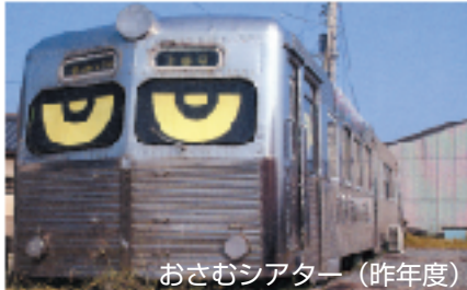
おさむシアター (昨年度)