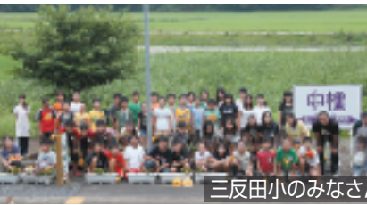
三反田小のみなさん

7月14日朝、那珂湊駅西側のハマギク花壇で今年度2回目の除草作業を近隣の自治会のみなさんが実施しました。ありがとうございます=写真右。