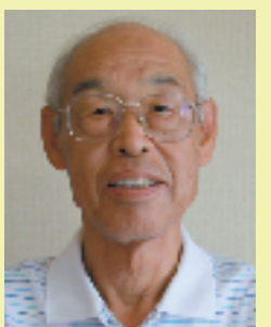
7月1日朝 中根駅にて

四季折々の花木が、楽しめるような駅にしようと努力していますが、道半ば。一度、手伝いに来たらよかつて。見に来たらよかつて。