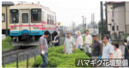
ハマギク花壇整備