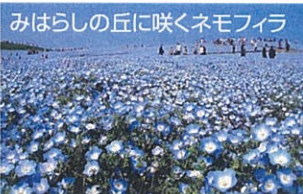
みはらしの丘に咲くネモフィラ

海浜鉄道では4月28日から5月20日までの土・日・祝日に、阿字ヶ浦駅から国営ひたち海浜公園までのシャトルバスを同園の開園時間帯に運行します。乗車賃は一昨年まではフリー切符購入者に限り無料でしたが、今年は湊線利用のお客様すべてが無料となります。同園はこの時期、みはらしの丘のネモフィラ450万本が開花するなど一年で最も花々が彩られる季節。今年は寒さで開花が遅れた分、連休後半にはチューリップとネモフィラの両方が楽しめそうです。5月5日(小学生)と13日(入園が無料(駐車料金は必要))。開園時間は9:30~17:00です。