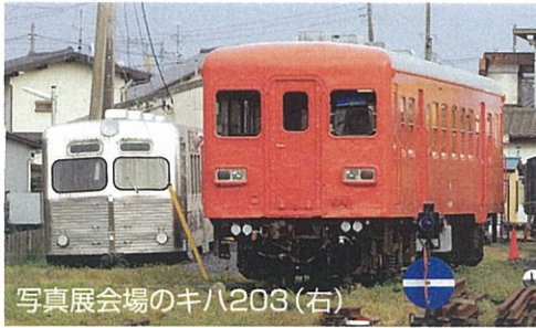
写真展会場のキハ203(右)

昨年、那珂湊駅で開催された東北の鉄道応援チャリティー写真展がきっかけで結成された「D.E.F」初のグループ展。メンバー12名のほか、応援団写真部員ら総勢19名が出展します。