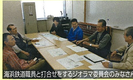
海浜鉄道職員と打合せをするジオラマ委員会のみなさん

「ジオラマ委員会」のみなさんは、10月27日の記念祭に向けて阿字ヶ浦駅駅舎内にNゲージのジオラマ製作・展示の計画を進めています。