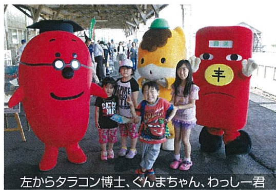
左からタラコン博士、ぐんまちゃん、わっしー君