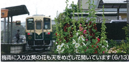
梅雨に入り立葵の花も天をめざし花開いています(6/13)