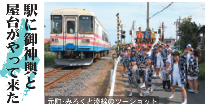
元町・みろくと湊線のツーショット