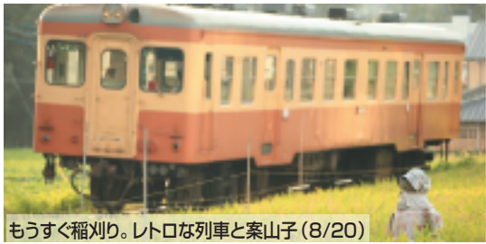
もうすぐ稲刈り。レトロな列車と案山子(8/20)