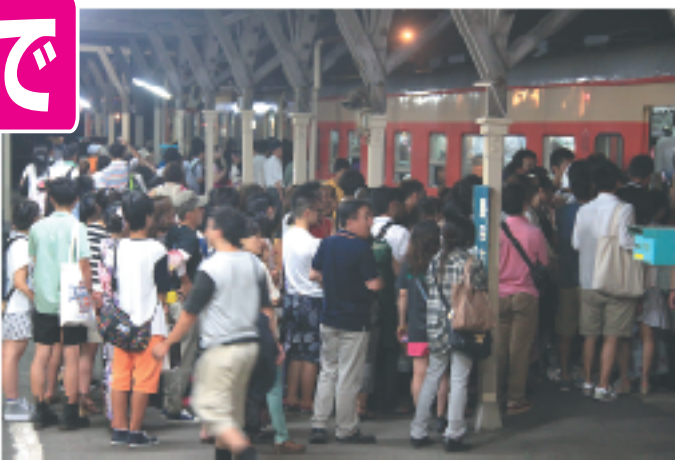
花火終了直後の増結便。この後の臨時便も乗客であふれました