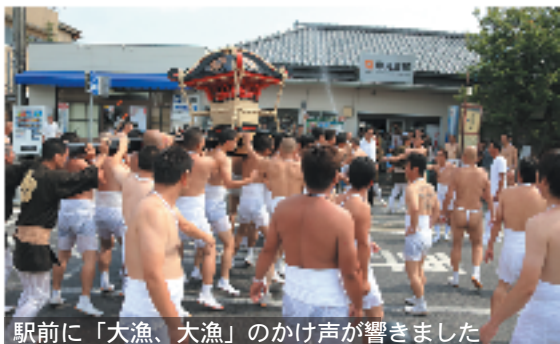
駅前に「大漁、大漁」のかけ声が響きました