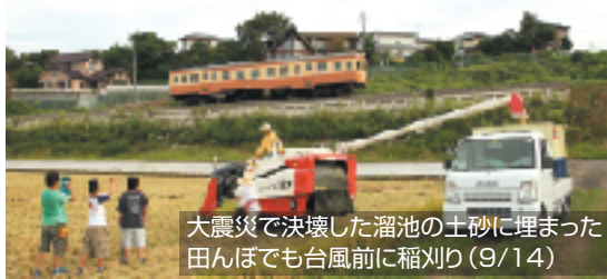
大震災で決壊した溜池の土砂に埋まった田んぼでも台風前に稲刈り(9/14)