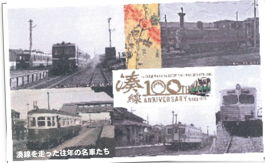
湊線を走った往年の名車たち