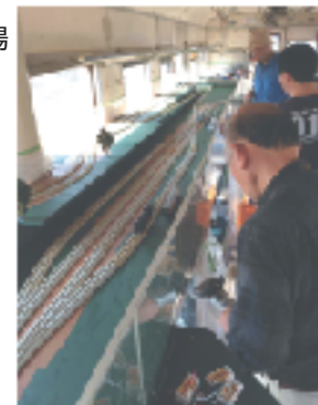
100周年に向けて作業が進む 応援団のHOゲージ