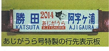
あじがうら号特製の行先表示板

海浜鉄道と応援団の共同企画で、第7回目となる初日の出・初詣列車が元日早朝に運行され、2本の列車でこれまで最高の合わせて約350名のお客様が乗車されました。