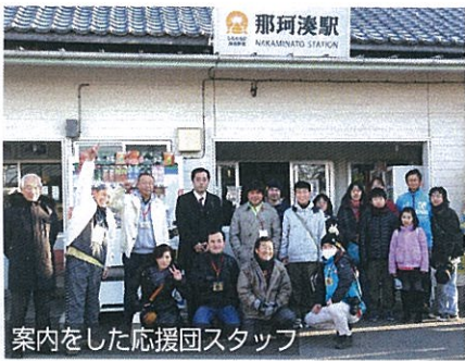
案内をした応援団スタッフ

今年は天気予報通りの素晴らしい初日の出となり、乗客の方からは「こんなきれいな初日が見られて今年一年良いことがありそう」という声が聞かれました。お客様には、ほしいもやホテルニュー白亜紀の無料入浴券、カレンダーなどが入った「福袋」が先着300名にプレゼントされました。また、各神社や同ホテルでも温かいおもてなしをいただきました。関係企業団体の皆様の絶大なご協力ありがとうございました。