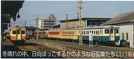
冬晴れの中、日向ぼっこするかのような旧型車たち(1/18)