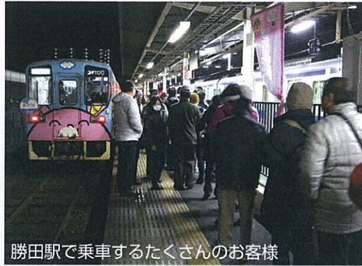
勝田駅で乗車するたくさんのお客様