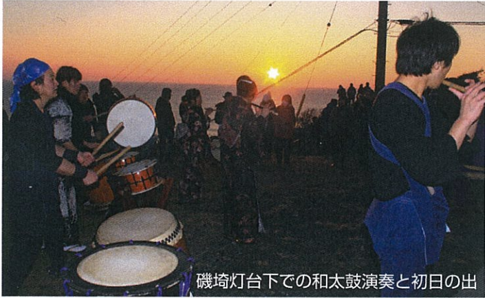
磯崎灯台下での和太鼓演奏と初日の出