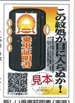
新しい乗車証明書(表面)