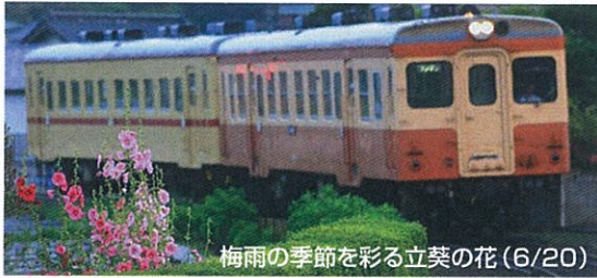
梅雨の季節を彩る立葵の花(6/20)