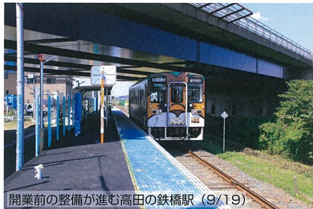
開業前の整備が進む高田の鉄橋駅(9/19)