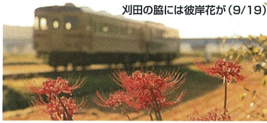
刈田の脇には彼岸花が(9/19)