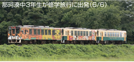
那珂湊中3年生が修学旅行に出発(6/6)