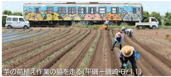
芋の苗植え作業の脇を走る(平磯-磯崎6/11)