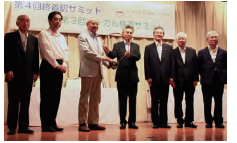
本間市長から立岩区長にタブレットが引き継がれました

また、同時開催されたサマースクールには50名が参加、延伸予定地や沿線の視察、研修などをおこないました。