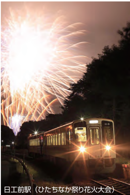
日工前駅(ひたちなか祭り花火大会)