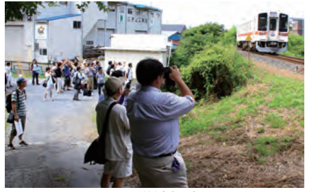
サマースクールの沿線視察