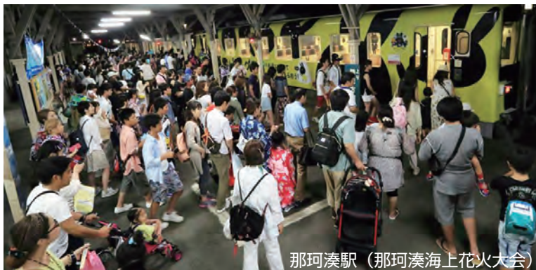
那珂湊駅(那珂湊海上花火大会)