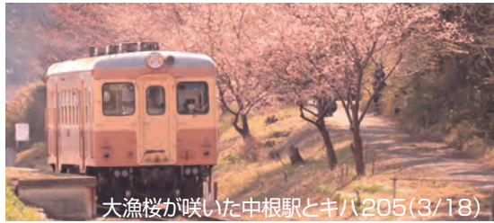
大漁桜が咲いた中根駅とキハ205(3/18)