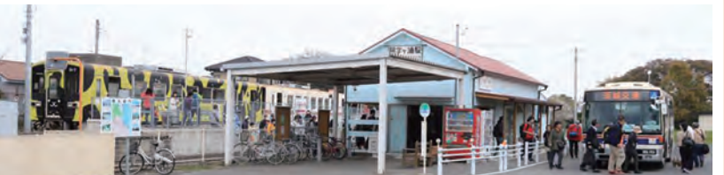
シャトルバス運行初日(4/22)朝の阿字ヶ浦駅

入園券付湊線一日フリー切符(大人1,100円、65歳以上1,000円、中学生900円、小学生500円)を購入すれば、同公園で入園券購入の列に並びことなく入場ができます。フリー切符は湊線各駅で乗り降りが自由なので買い物などにも便利です。地元の方は空いている平日がオススメです。