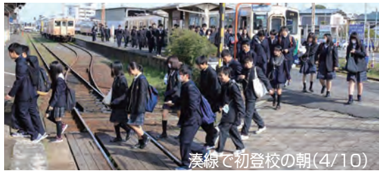
湊線で初登校の朝(4/10)