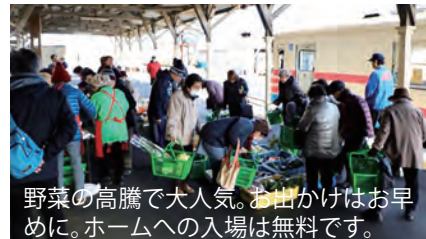
野菜の高騰で大人気。お出かけはお早めに。ホームへの入場は無料です。