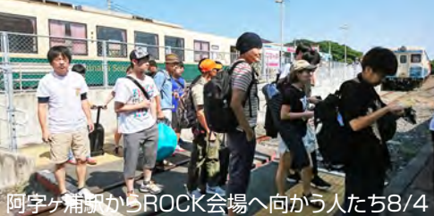
阿字ヶ浦駅からROCK会場へ向かう人たち8/4