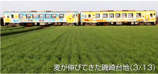
麦が伸びてきた磯崎台地(3/13)