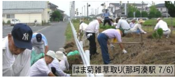
はま菊雑草取り(那珂湊駅 7/6)