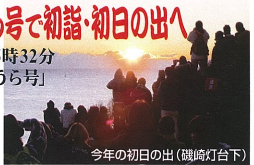
今年の初日の出(磯崎灯台下)