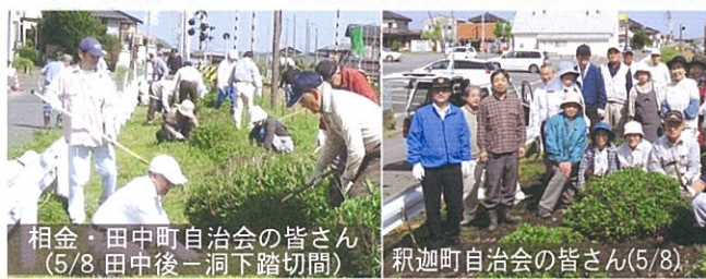
相金・田中町自治会の皆さん(5/8 田中後-洞下踏切間)