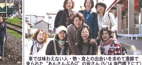
車では味わえない人・物・食との出会いを求めて湊線であられた「あんさんぶるQ」の皆さん(5/14 海門橋下にて)