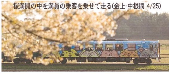
桜満開の中を満員の乗客を乗せて走る(金上-中根間 4/25)