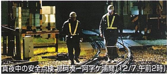
真夜中の安全点検 那珂湊-阿字ヶ浦間(12/7 午前2時)