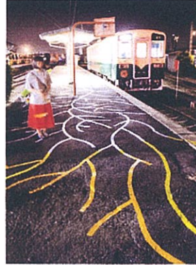
▲ホームにはこんな作品も