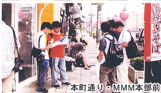
本町通り・MMM本部前