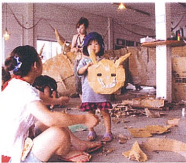
▲8/13~15にワークショップを開催=阿字ヶ浦海岸・いるか

湊線とまちがミュージアムに—。昨年引き続き「みなとメディアミュージアム(MMM)」が7月24日から9月5日(日)まで湊線駅舎や車輜、そして本町通り・明神町商店街や阿字ヶ浦海岸などの協力店で開催中です。今年は展示会場22か所、参加アーティスト34人と大幅に増えてジャンルも展示作品ばかりでなく、コンピュータと組み合わせた映像や音の作品など多岐にわたっています。