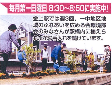
毎月第一日曜日 8:30~8:50に実施中! 金上駅では週3回、一中地区地域のふれあいを広める会環境部会のみなさんが駅構内に植えられた花の手入れを続けています。

※前号記事のはまぎくの除草作業には関戸町自治会からも参加をいただいております。ありがとうございました。