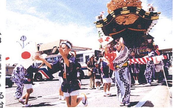
那珂湊駅前を踊りを披露する龍ノ口町屋台

8月5日から8日まで年番・元町で執行された八朔祭で、今年も各町屋台と御神輿がメインの7・8日に那珂湊駅前に行ってきました。市外からの行楽客も、珍しい駅前への屋台の運行に盛んにカメラを向けていました。今年は平磯や磯崎でも祭りがあり、浴衣姿で乗降する利用客が目立ちました。