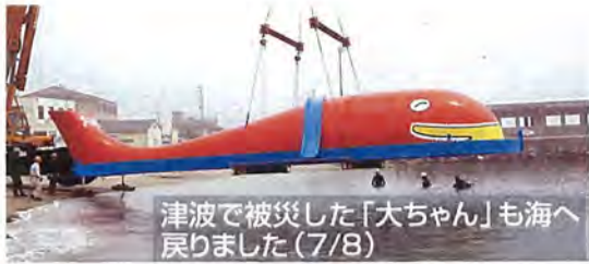
津波で被災した「大ちゃん」も海へ戻りました(7/8)