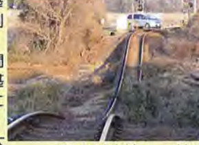
溜池が決壊し、線路が宙づり状態に

3.11 pm2:46 巨大地震発生。市内全域甚大な被害。午後5時近くには津波も到達。市内停電・断水、避難者も多数。湊線は全線で運転不能、中根一金上間で溜池崩壊により線路流出ほか被害甚大。運転中の列車は中根駅と殿山駅に停車し、乗員乗客の無事を確認。