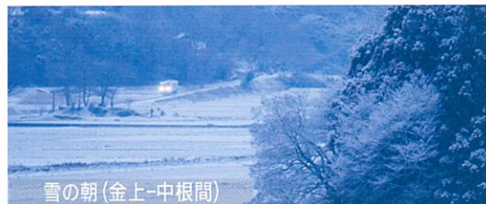
雪の朝(金上-中根間)