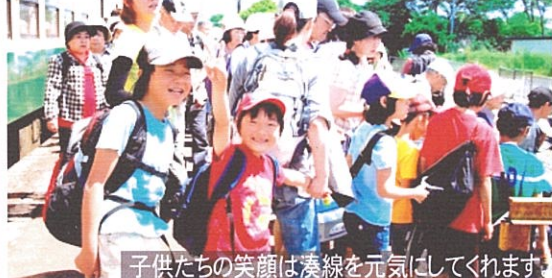
子供たちの笑顔は湊線を元気にしてくれます