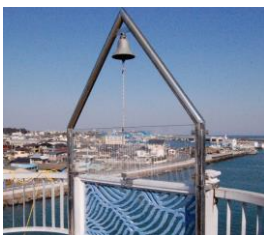
那珂湊と大洗を結ぶ海門橋に設置されているドリームベル(愛の鐘)