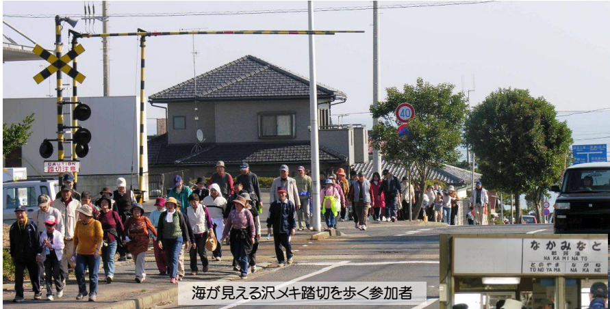
海が見える沢メキ踏切を歩く参加者

去る11月25日(日)、湊中学区区域を住みよくなる会体育部会主催による“史跡を巡る湊健康歩く会”が開催されました。毎年コースを替えて実施しているとのことで、今年は那珂湊駅から磯崎駅まで湊線を利用していただき、平磯海浜公園経由で那珂湊公民館まで歩くコースで行われました。