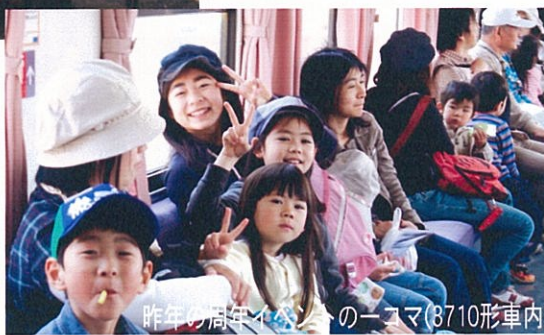
昨年の周年イベントの一コマ(3710形重連)

※イベントの詳細は市報(4/10号)、海浜鉄道ホームページ外でお知らせいたします。