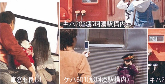
キハ203(那珂湊駅構内)

湊線は、乗っても、撮っても、沿線の人・自然もよし。車輛を撮るなら中根駅や磯崎駅周辺。番外編はギャラリー601でキハ203とケハ601をバックに写真をどうぞ。