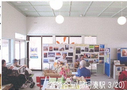
新待合室(那珂湊駅 3/20)

3/19、那珂湊駅が明るい待合室へリニューアル。金上駅も近い将来の車輛交換駅として一新されました。