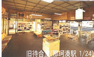
旧待合室(那珂湊駅 1/24)

那珂湊駅の利用者からは、「明るく温かい待合室になりましたね。隙間風さようならですね」と話してくれました。