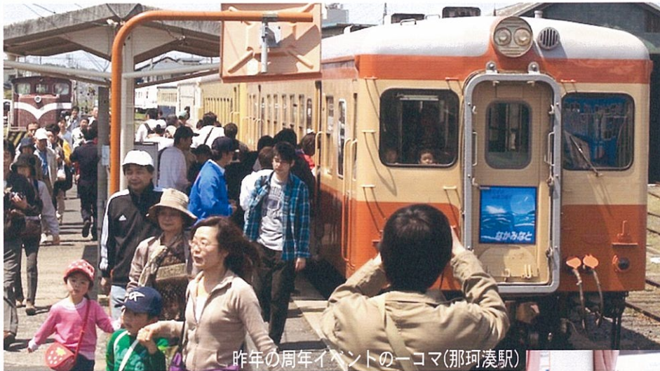
昨年の周年イベントの一コマ(那珂湊駅)