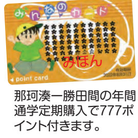
那珂湊-勝田間の年間通学定期購入で777ポイント付きます。