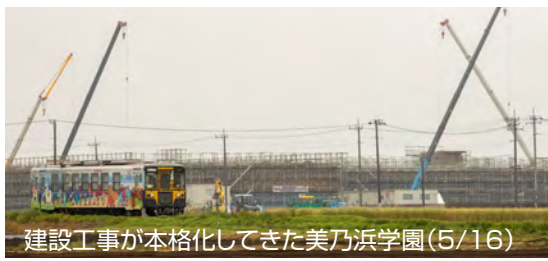
建設工事が本格化してきた美乃浜学園(5/16)