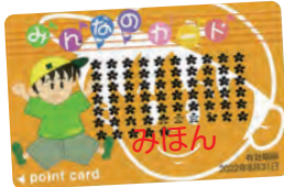
那珂湊-勝田間の年間通学定期購入で777ポイント付きます。