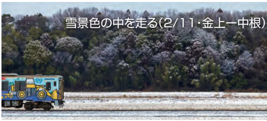
雪景色の中を走る(2/11・金上-中根)