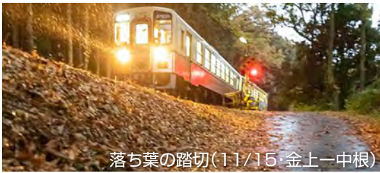
落ち葉の踏切(11/15 金上-中根)