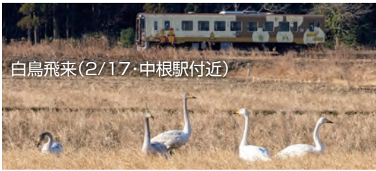
白鳥飛来(2/17・中根駅付近)