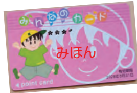
那珂湊-勝田間の年間通学定期購入で763ポイント付きます。