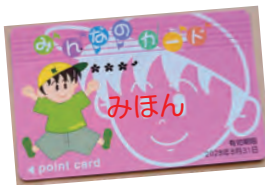
那珂湊ー勝田間の年間通学定期購入で763ポイント付きます。