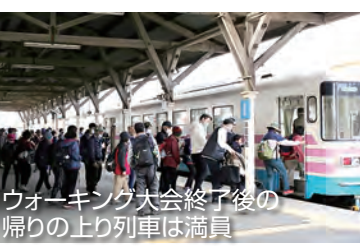
ウォーキング大会終了後の帰りの上り列車は満員