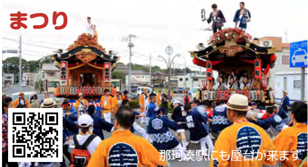
那珂湊駅にも屋台が来ます

第34回 那珂湊海上花火大会 9月9日(土)(雨天時は10日(日)に順延) 那珂湊漁港(駐車場なし) 最寄駅 那珂湊 19:00～20:00 打ち上げ ※応援団では、那珂湊駅でお子様に水ヨーヨーをプレゼントいたします。