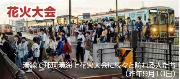
湊線で那珂湊海上花火大会に続々と訪れる人たち(昨年9月10日)

第29回 ひたちなか祭り花火大会 8月19日(土)(雨天時は21日(月)に順延・無観客で実施) 4年ぶりに自衛隊勝田駐屯地で開催 最寄駅 金上 15:00～開場 17:45～オープニングセレモニー 19:30～20:30 打ち上げ