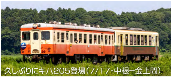
久しぶりにキハ205登場(7/17・中根～金上間)