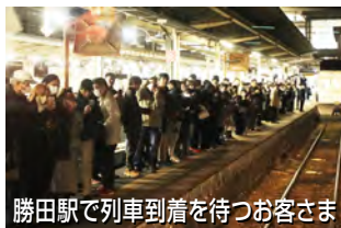
勝田駅で列車到着を待つお客さま

ことしは、フリー切符が割引販売されたためか、勝田地区在住で「初めて湊線に乗りました」という方が多く、「湊線で来ると海が近いですね」などと感想を漏らしていました。たくさんのご参加ありがとうございました。