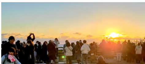
白亜紀層海岸に昇る初日の出