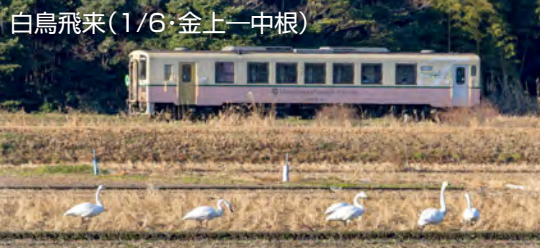
白鳥飛来(1/6・金上一中根)