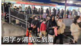
阿字ヶ浦駅に到着