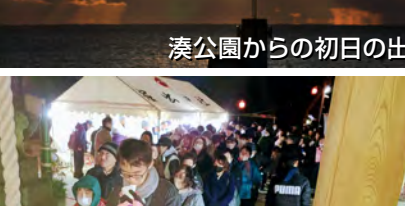
参拝を待つ長い列(堀出神社)