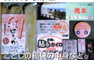
ことしの福袋の中身など

酒列磯前神社・堀出神社・ほしいも神社・榎原神宮・天満宮・四郎介稲荷・和奏・茨城中央ほしいも協同組合・ホテルニュー白亜紀・ひたちなか商工会議所・那珂湊高校(順不同・敬称略)