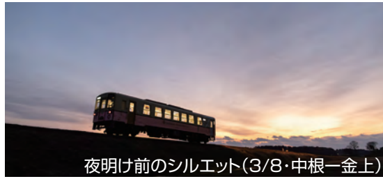
夜明け前のシルエット(3/8・中根一金上)