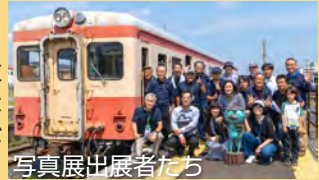
写真展出展者たち

引退したキハ205の車内で開催した写真展には全国各地から574人のご来場をいただきました。