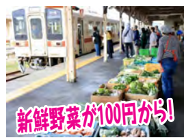
新鮮野菜が100円から!

■7月5日(日)午前9時~10時半頃まで ■那珂湊駅1番線ホーム ※ホームへの入場は無料です。