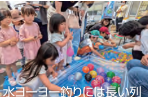
水ヨーヨー釣りには長い列