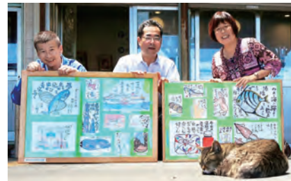
絵手紙列車が走ります

今回のテーマは「キハ100形 やっと安心ね!」「いよいよ始まる測量設計」です。23都府県199人の皆さんが描いてくれた269枚の絵手紙は、6月中旬から9月末まで湊線車輦内のほか、1番線ホームに掲示されます。全国からの素敵な絵と心温まる応援メッセージをぜひご覧ください。