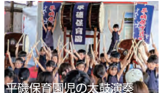
平磯保育園児の大鼓演奏

梅雨の晴れ間の好天に恵まれた6月13日の「海浜鉄道開業記念祭2026」には、コロナ禍以降最高の人出となり、親子連れや鉄道ファンで3両運転の列車は終日満員になりました。那珂湊駅ではステージイベント、鉄道各社の物販や地元食材、地元高校開発品の販売などが上りホームでおこなわれたほか、子ども向けのヨーヨー釣りなどで賑わいました。また、今回初出展になった美乃浜学園駅前でもキッチンカーや子ども運転士制服体験などで大賑わいでした。