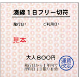
湊線1日フリー切符

発行日: ご利用日: 見本 大人800円 発行日から1年内 利用可能(1日限り有効) 運賃 改定