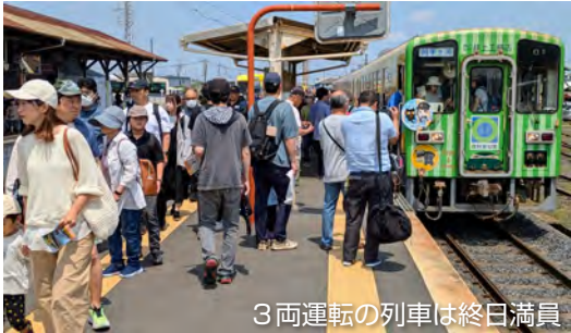
3両運転の列車は終日満員